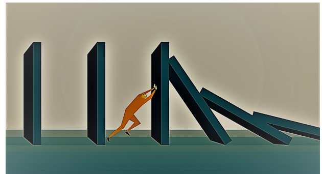
Strategiile bazate pe creștere cu orice cost sunt de domeniul trecutului. Aproape 50% dintre companiile care au preocupări intense de îmbunătățire a costurilor nu își ating obiectivele.

Răspunsul Exegens este simplu: noi ne bazăm pe experiența excepțională a clienților noștri și o transformăm într-un parteneriat.